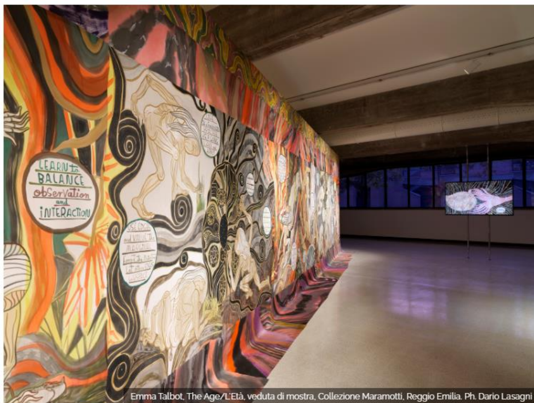
Emma Talbot, The Age/L'Età , veduta di mostra, Collezione Maramotti, Reggio Emilia.