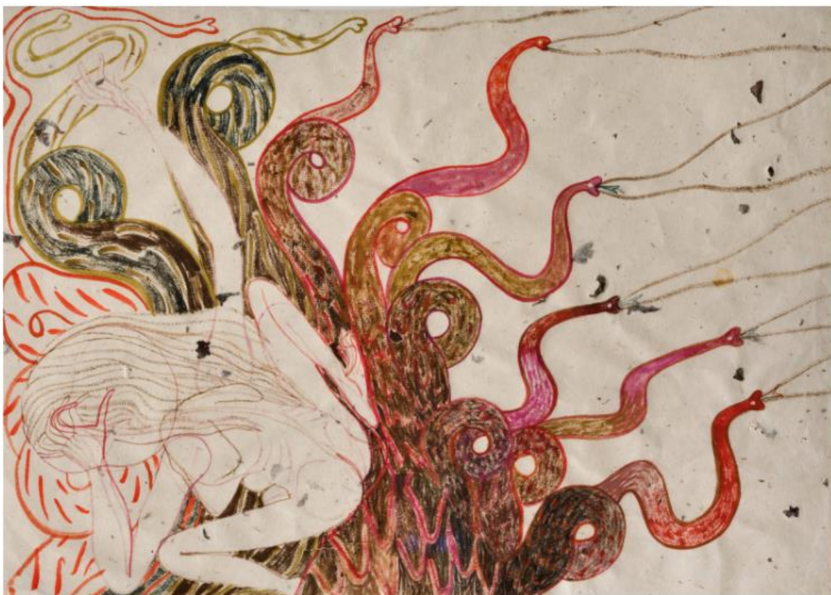
Emma Talbot, The Lernaean Hydra , 2022, acquerello e gouache su Khadi paper, dettaglio di The Trials .

Punto di partenza è stato il dipinto Le tre età della donna di Gustav Klimt: nella sua opera Talbot reinventa la figura della donna anziana, dipinta con il capo reclinato tra le mani, elevandola a nuovo paradigma di eroe. «Le fatiche di Ercole – si legge nell'intervista rilasciata dall'artista a Bina Von Stauffenberg e pubblicata all'interno del prezioso catalogo che accompagna la mostra – sono un ciclo di dodici prove eroiche portate a termine mediante l'uccisione, la cattura, il furto e altri atti di aggressione. Sembra incredibile che tale violenza sia oggetto di tanta ammirazione. Ho pensato che sarebbe stato interessante immaginare una donna anziana e saggia alle prese con queste prove, ricorrendo a mezzi non aggressivi per trovare soluzioni più benevole, sulle quali costruire un mondo più equilibrato, giusto e gentile».