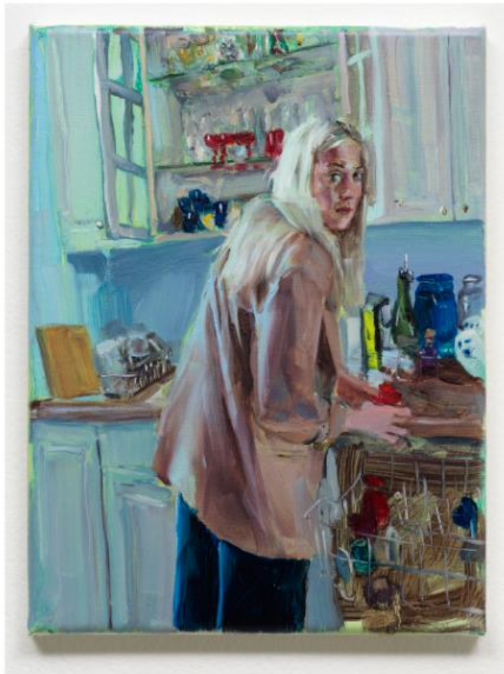
Jenna Gribbon, Shared warmth , 2022, olio su lino, 30,5 x 40,6 cm. Courtesy of the artist and MASSIMODECARLO. Ph. Dario Lasagni