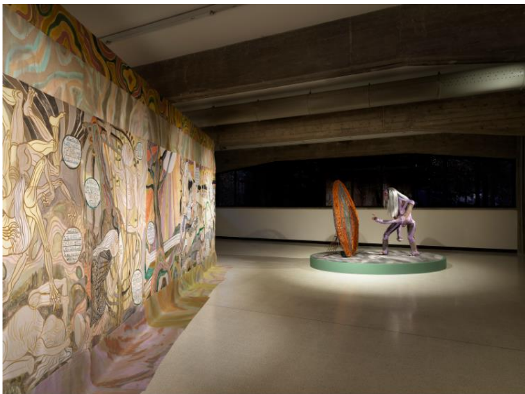
Emma Talbot, The Age/L'Età , veduta di mostra. Collezione Maramotti, Reggio Emilia.

Oltre alle mostre di Gribbon e Talbot, la Collezione Maramotti ospita, fino al 31 dicembre 2022, le fotografie di grande formato del progetto Bellum , commissionato a Carlo Valsecchi in occasione di Fotografia Europea , ed una piccola riorganizzazione del percorso permanente con l'aggiunta di tre lavori di Claudia Losi , esposti al pubblico in occasione della presentazione del libro Being there. Oltre il giardino , a cura di Leonardo Regano (Ed. VIAINDUSTRIALE Publishing).