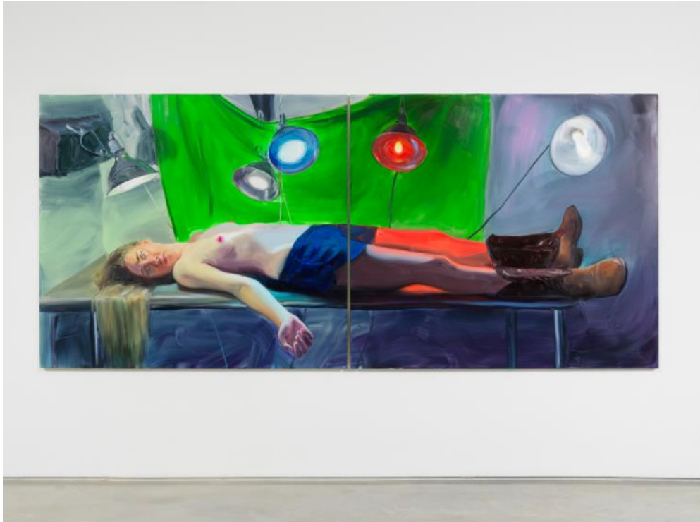
Jenna Gribbon, Here for you , 2022, olio su lino, 162,5 x 406 cm.