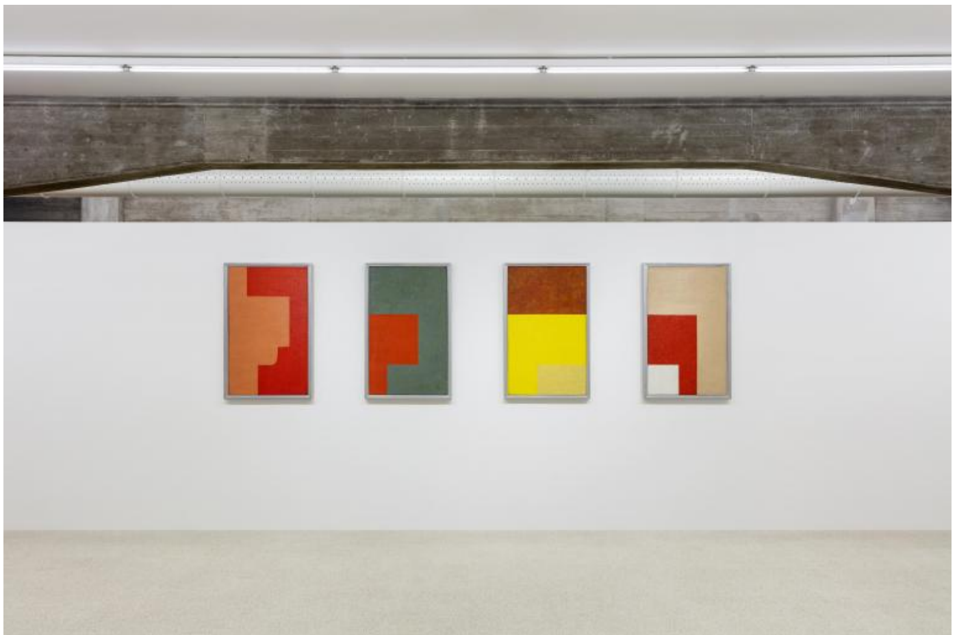
Władysław Strzemiński, Composizioni architettoniche, 1928-29

Il programma era ampio e ambizioso: una trasformazione complessiva della realtà ispirata alle nuove possibilità individuate dalle esperienze artistiche, i cui modelli compositivi sarebbero stati capaci di generare soluzioni inedite per l'architettura, l'urbanistica, l'industria, l'organizzazione sociale. In altre parole, per usare un importante concetto dell'antropologo dell'arte Alfred Gell, per Strzemiński esisteva (e andava evidenziato) nell'attività di creazione un "isomorfismo strutturale" tra qualcosa di "interno" (la coscienza da un lato e la forma artistica dall'altro) e qualcosa di "esterno" – l'insieme delle relazioni sociali future. Le opere d'arte erano pensate in questa prospettiva come "oggetti distribuiti" che combinavano con coerenza esemplarità immanente e dispersione spazio-temporale, ed esercitavano una funzione insieme pedagogica e politica. Strzemiński riteneva in effetti che quando non solo gli artisti, ma ingegneri, semplici operai, tecnici, politici, avrebbero compreso e accettato l'arte d'avanguardia, sarebbe stato possibile trasferire le sue idee nella sfera pratica, secondo una concezione per la quale la "logica dell'atteggiamento nei confronti della vita" sarebbe dovuta derivare dalla "logica dei metodi artistici", per citare un suo testo del 1931.