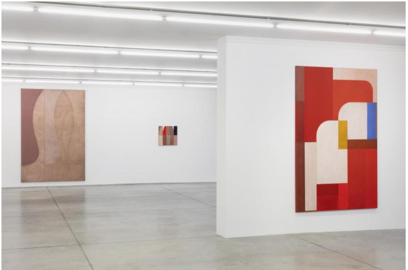
Svenja Deininger, Vista della mostra, Collezione Maramotti, 2020