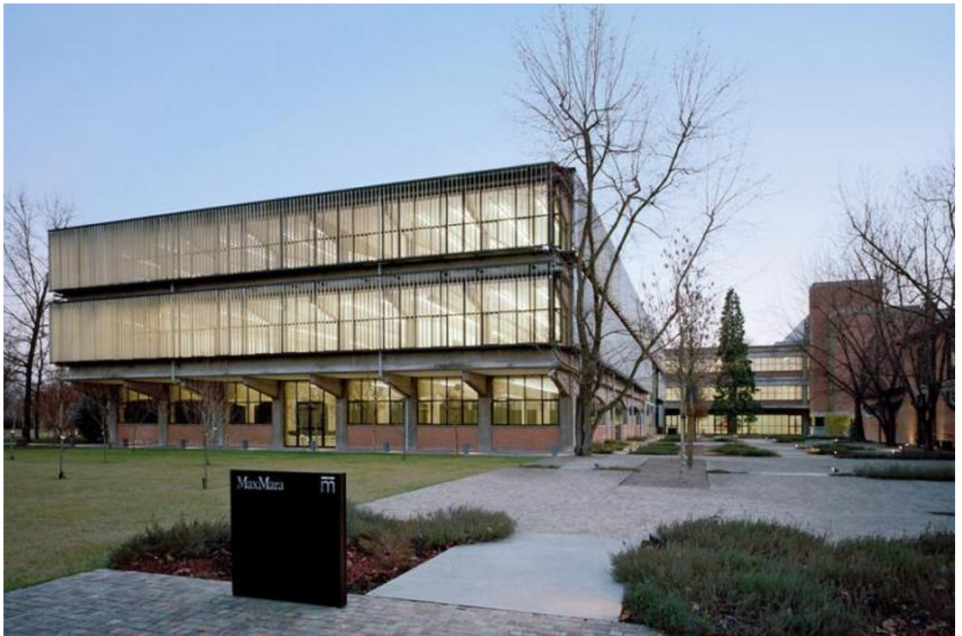
Collezione Maramotti, Reggio Emilia

A tutto questo penso mentre percorro le sale della Collezione, che include opere realizzate dal 1945 ai nostri giorni in un insieme unico per qualità e ampiezza di prospettive che ne fa in effetti, nei fatti se non nel nome, uno dei pochi, veri musei di arte contemporanea del nostro paese. Scoprendo il nuovo e bell'allestimento inaugurato nel 2019, mi appare ancor più chiaramente come questa raccolta, in maggioranza pure se non esclusivamente costituita da "pitture", riesca non solo a testimoniare persuasivamente la vitalità del medium artistico più tradizionale attraverso le caotiche stagioni del secondo Novecento e dei primi Duemila, ma soprattutto a far emergere il suo strano, enigmatico, perdurante potere, la sua reticenza a farsi arruolare in un discorso reazionario (il famigerato "mestiere"), la tenace rivendicazione di un proprio spazio e tempo speciali.