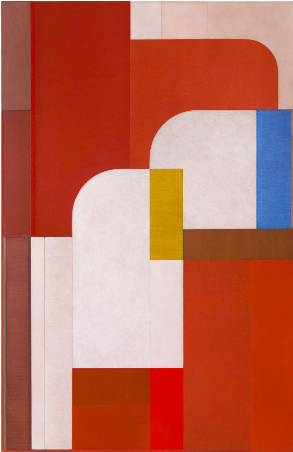
Svenja Deininger, Senza titolo, 2020

Un buon esempio dell'operazione realizzata da Deininger, nata a Vienna nel 1974, è la grande tela che apre la mostra, Senza titolo (2020), la cui superficie rettangolare riprende sia la proporzione allungata dei quadri di Strzemiński sia soprattutto il gioco di sagome incastrate le une nelle altre secondo rigorosi andamenti ortogonali e curvilinei tipico delle sue composizioni astratte. I piani colorati – dipinti con differenti texture in toni che vanno dal rosa pallido al rosso acceso, più due inserti contrastanti (giallo e azzurro) – moltiplicano e complicano più sobrie soluzioni del pittore polacco, dando all'opera un'intonazione marcatamente ritmica e “grafica”, come accade nel genere musicale della variazione, dove un tema viene diffratto, dilatato e trasformato fino quasi a perdere rapporto con l'originale senza tuttavia giungere a negare la stretta parentela con