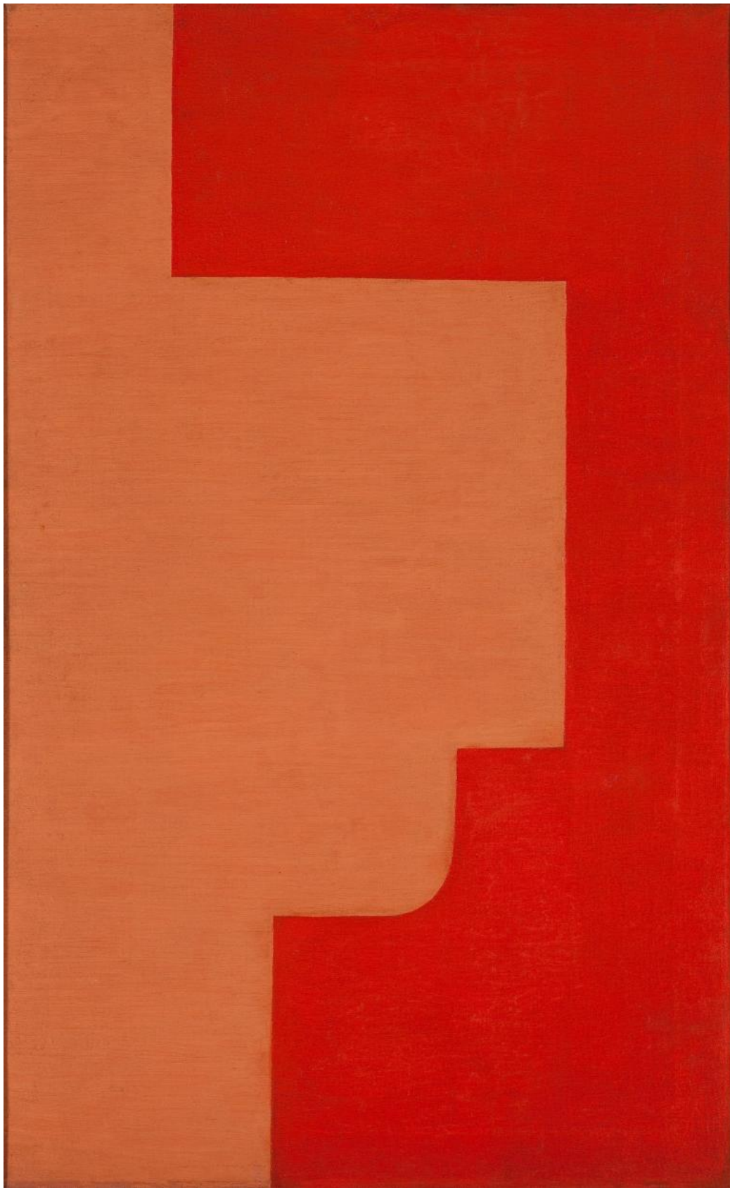
Władysław Strzemiński, Composizione architettonica 6b, 1928

Le pitture di Strzemiński, così come le coeve costruzioni geometriche tridimensionali di Kobra, cercano in effetti di risolvere la contraddizione tra il rivoluzionamento modernista-astratto del mondo delle forme e il loro effetto concreto nella vicenda storica e politica, un tema costantemente dibattuto nei circoli avanguardisti tra le due guerre e che è rimasto essenziale sino alle soglie dell'epoca postmoderna. L' unismo tenta di trovare una soluzione originale a questo problema, con l'obiettivo di preservare l'indipendenza dell'attività artistica, dunque resistendo all'appello a dissolvere l'opera nello spazio sociale e nei processi produttivi industriali lanciato in