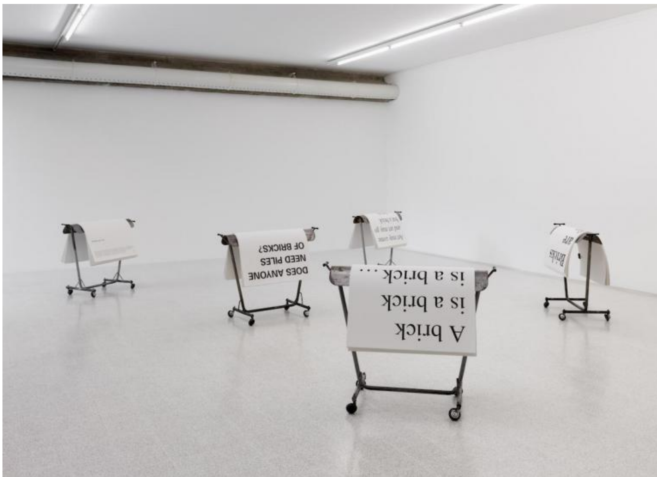
Elisabetta Benassi, "It starts with the firing", 2017. Cinque elementi metallici, manifesti, traccia audio, dimensioni variabili. Courtesy Collezione Maramotti © Elisabetta Benassi. Ph. Andrea Rossetti.

Tra le sale aleggia una presenza le cui spoglie sono proprio quegli stessi mattoni, quei luoghi e quelle macchine ormai destinate a usi ben diversi da ciò che era la loro funzione originale. È il fantasma del lavoro, la scomparsa dell'industria e il conseguente vuoto – sociale, politico, culturale – che questo lutto lascia dietro di sé. Non a caso il titolo dell'esposizione gioca sul doppio piano dell'elaborazione artistica e sulla parola "firing" che indica il licenziamento, richiama il collasso del mondo operaio, il tramonto dell'era industriale e delle "magnifiche sorti e progressive" che ha segnato il Novecento. La ricerca della Benassi come una seduta spiritica, in cui vengono evocati e predisposti all'incontro con il presente gli spettri del terrorismo, del marxismo, del femminismo, del fascismo, della rivoluzione, del minimalismo, di Walter Benjamin, Marx, M'Fumu, Pasolini, Gramsci, Aby Warburg, Lyotard, Angela Davis, Derrida, Mario Merz, Buckminster Fuller e di quel "Quarto Stato" ormai feticizzato, con le masse di operai che marciano solo nei fotogrammi dei documentari d'epoca. Quella classe operaia che non è andata in paradiso e oggi stenta a trovare le coordinate di un mondo post-industriale.