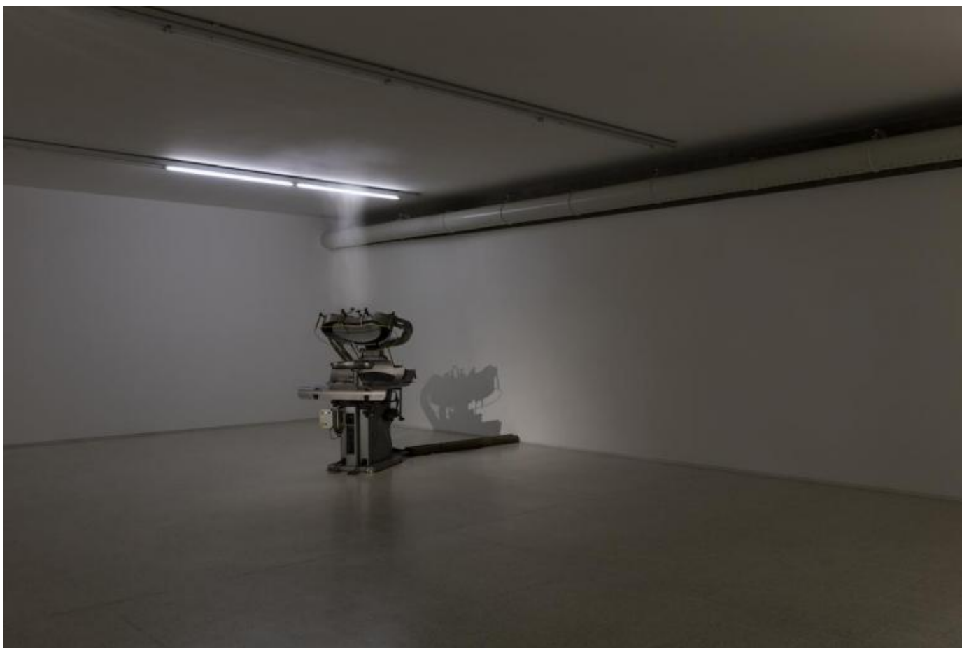
Elisabetta Benassi, “Prosperity”, 2017. Macchina da stiro automatizzata, vapore, 157 x 100 x 120 cm. © Elisabetta Benassi.

Entrando alla Collezione Maramotti di Reggio Emilia, il percorso espositivo concepito da Elisabetta Benassi accoglie lo spettatore con una stiratrice industriale dal titolo Prosperity . Con la sua concretezza metallica, l'oggetto ha un fascino retro-futuristico, reperto di un'antica civiltà aliena ormai inesorabilmente estinta, precipitato nell'atmosfera dopo un lungo viaggio siderale. Nella solitudine della sala espositiva sembra di sentire il respiro pesante del mastodonte meccanico, ingombrante e quasi commovente nella sua coazione a ripetere all'infinito lo stesso movimento.