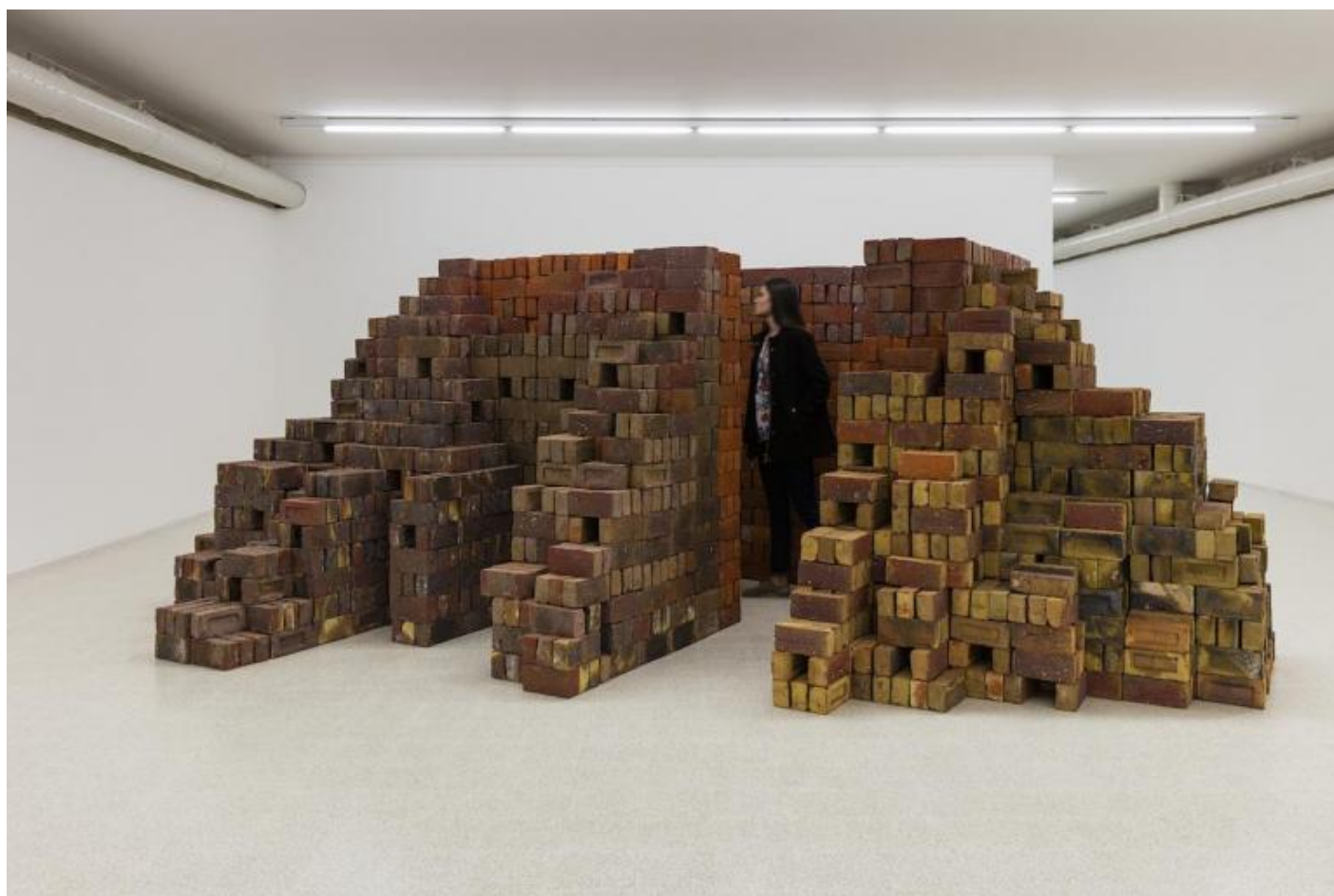
Elisabetta Benassi. "Zeitnot", 2017. Cinquemila mattoni refrattari inglesi, 175 x 500 x 380 cm. Courtesy Collezione Maramotti © Elisabetta Benassi. Ph. Andrea Rossetti.

Affrontando il corpus delle sue opere spesso si è scomodata la categoria degli spettri, ma bisognerebbe forse chiamare in causa la figura del revenant , con tutta la sua forza archetipica. La ri-messa in scena di elementi cristallizzati in una forma e in un significato assodati nel tempo pone lo spettatore di fronte a quella condizione di spaesamento che assomiglia molto a quel perturbante che si insinua in colui che accoglie il ritorno a casa del "ritornante": un senso di angoscia legata alla certezza del conosciuto che si sgretola, la paura di affrontare una estraneità in ciò che è più familiare, il timore della sostituzione dell'oggetto affettivo con un feticcio maligno. Non ultima, la paura del ritorno da una zona d'ombra – la morte come paradigma di stasi a cui solo la memoria ha diritto di accesso – e il timore della trasfigurazione di un oggetto (o soggetto) in un agente estraneo e incontrollabile.