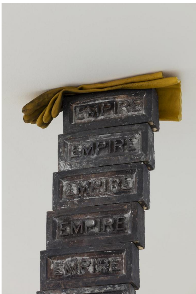
Elisabetta Benassi, “Infinity”, 2017. Bronzo, cunei in legno, guanti, 310 x 40 x 47 cm, particolare.

Una colonna di mattoni sghembi con impressa la parola “Empire”, sulla cui sommità sono incastrati un paio di guanti da lavoro e, zeppe di legno a contrastare la pericolosa inclinazione che preannuncia un disastroso crollo: è Infinity , l'opera che richiama La Colonna senza fine di Costantin Brancusi, padre putativo del minimalismo, ma anche e soprattutto Manifest Destiny (1986) di Carl Andre.