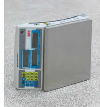
JASON DODGE, “Scale”, 2011

Curator: Federico Ferrari, Professor of Philosophy of Art, Accademia di Brera (Italy)