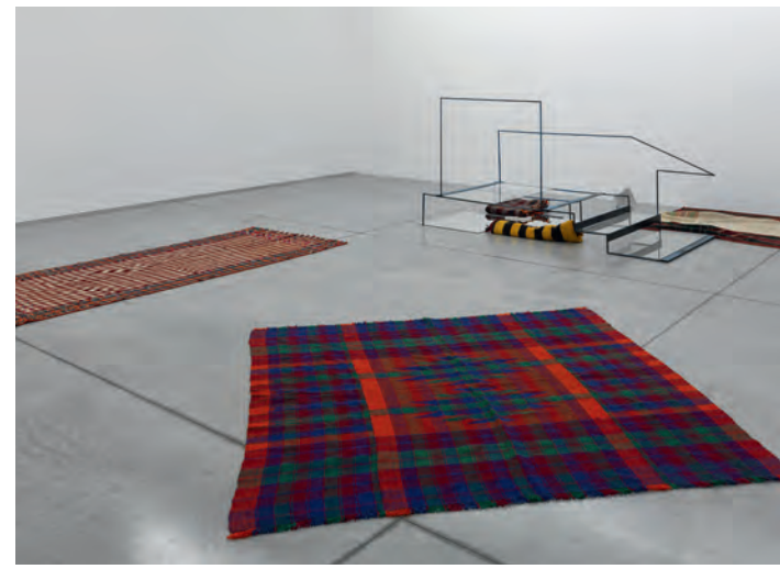
THEA DJORDJADZE, „I trust the liar. With pleasure, tea“, 2011

Informationen zu weiteren Veranstaltungen unter: www.fkv.de .